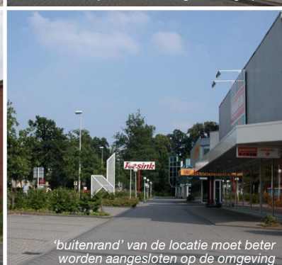
'buitenrand' van de locatie moet beter worden aangesloten op de omgeving