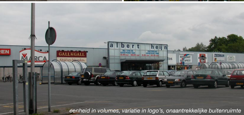
eenheid in volumes, variatie in logo's, onaantrekkelijke buitenruimte