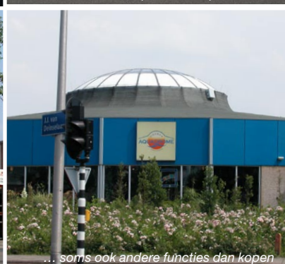
... soms ook andere functies dan kopen