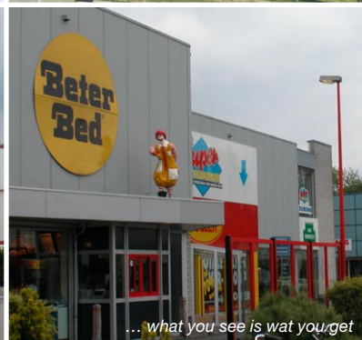
... what you see is wat you get