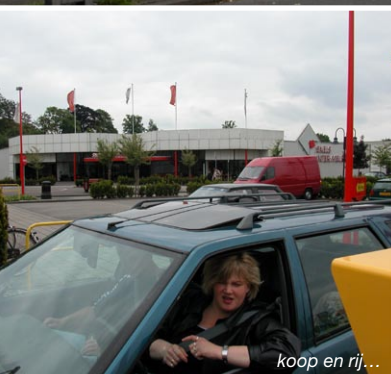
koop en rij...