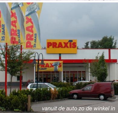
vanuit de auto zo de winkel in