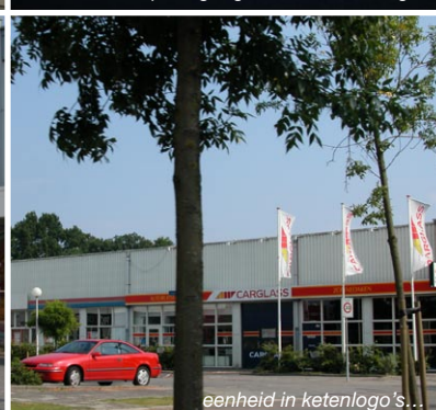
eenheid in ketenlogo's...