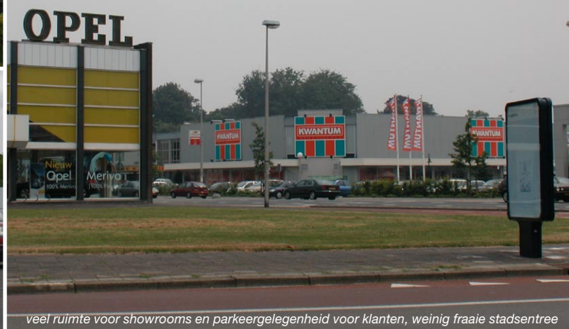
veel ruimte voor showrooms en parkeergelegenheid voor klanten, weinig fraaie stadsentree