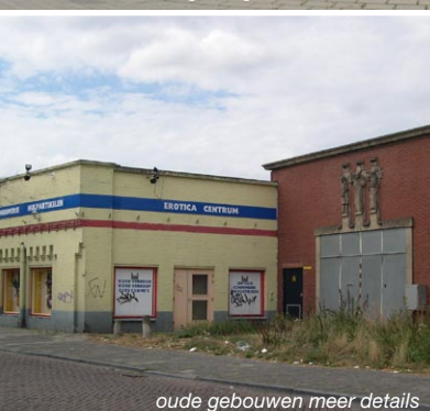
oude gebouwen meer details