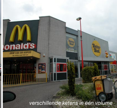
verschillende ketens in één volume