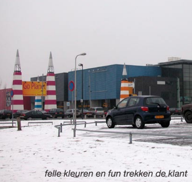
felle kleuren en fun trekken de klant