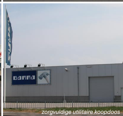
zorgvuldige utilitaire koopdoos