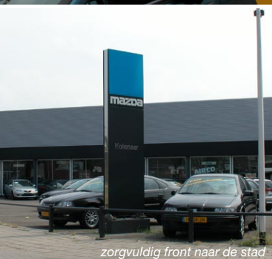
zorgvuldig front naar de stad