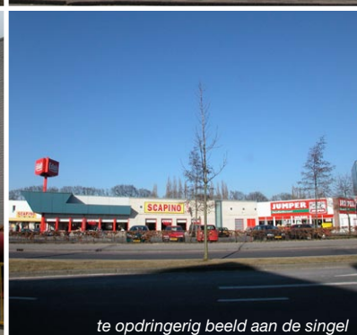
te opdringerig beeld aan de singel