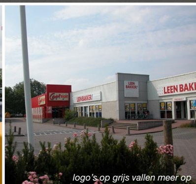
logo's op grijs vallen meer op